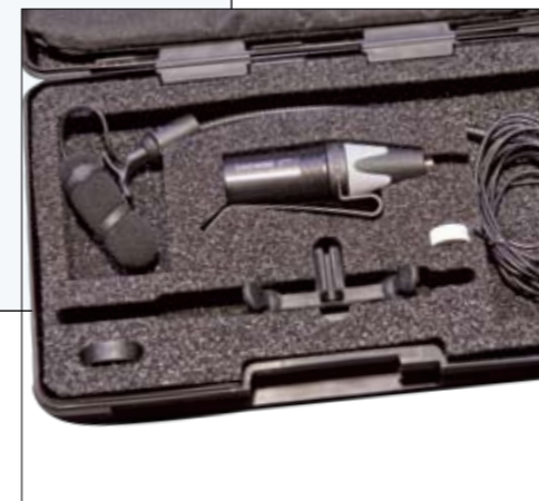
I PAKKEN: DPA 4099 med fullt tilbehør. Ledningen virker tynn, men importør forsikrer at den skal tåle tøff behandling.